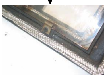
Détail porte - joint et fixation vitre